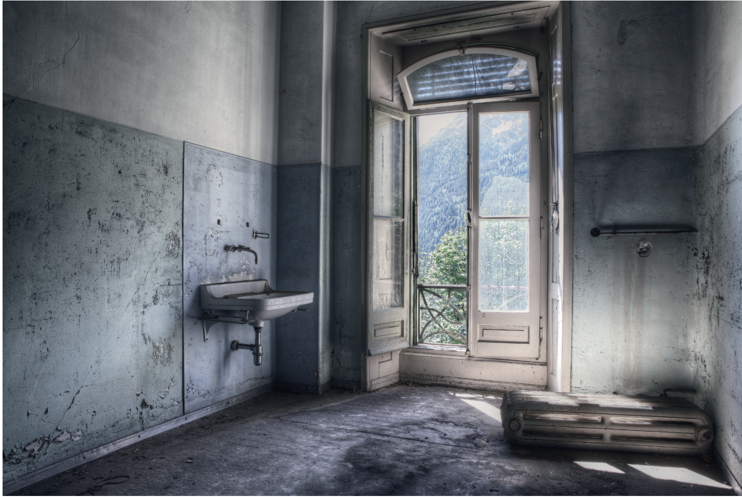
EIN MOTIV AUS DER AUSSTELLUNG „NACH SEINER ZEIT“ EINE SERIE VON BILDER VERLASSENER GEBÄUDE IN GANZ EUROPA

Direktdruck der Fotografien auf Lightboard ECO® 10 mm