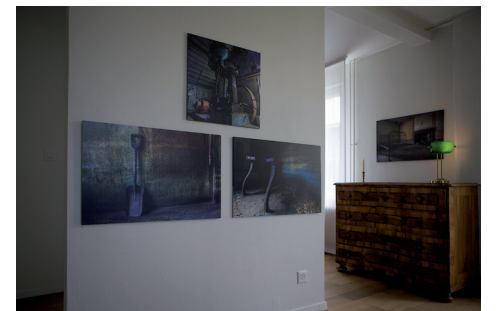
Bilder 50 x 75 cm, auf Lightboard ECO 10 mm